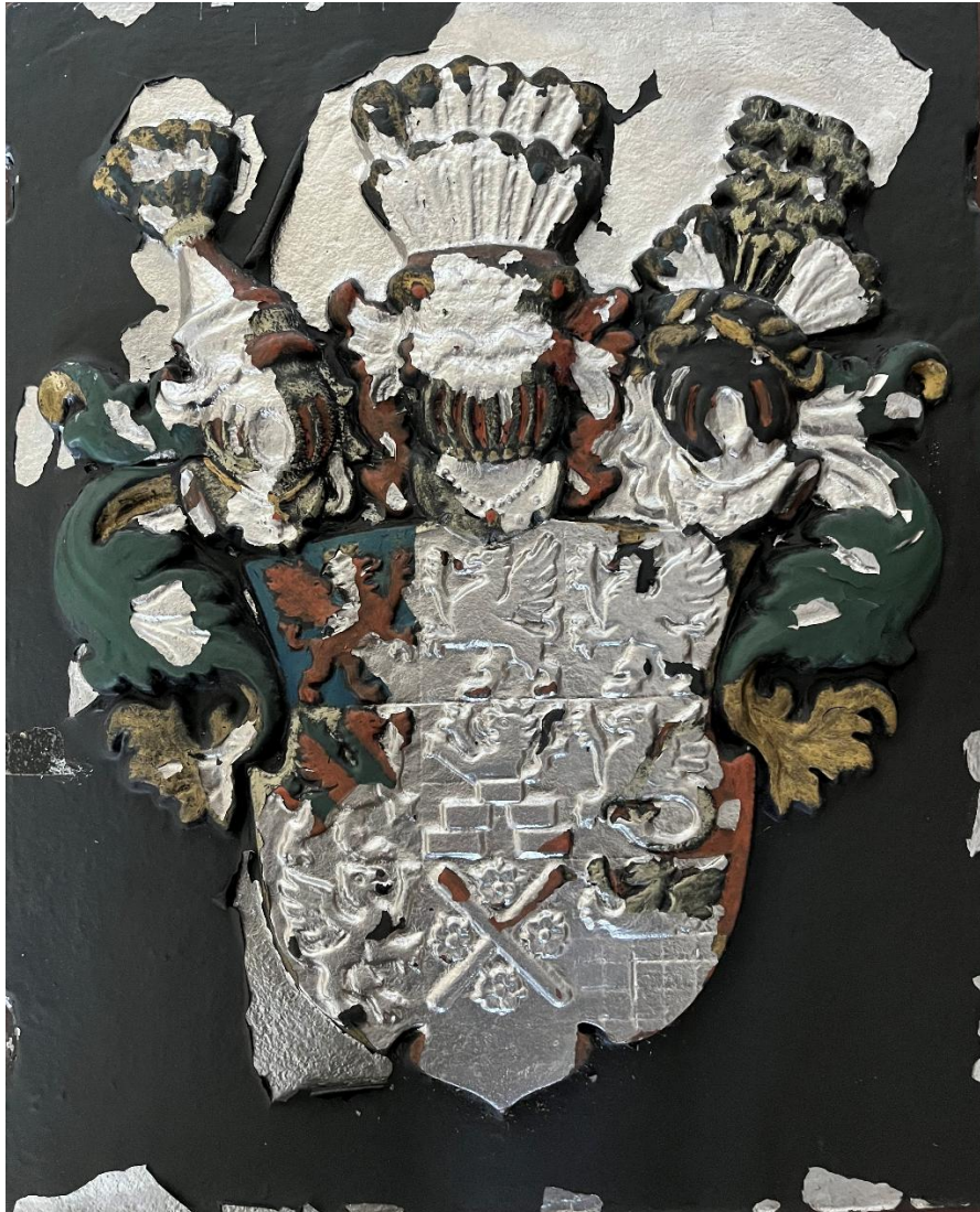
Metallplatte mit pommerschem Wappen, ca. 410 x 505 mm (Schenkung Dr. J.-Michael Schmidt, 2021)